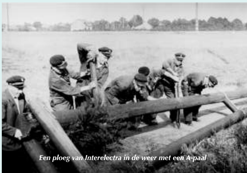
Een ploeg van Interelectra in de weer met een A-paal