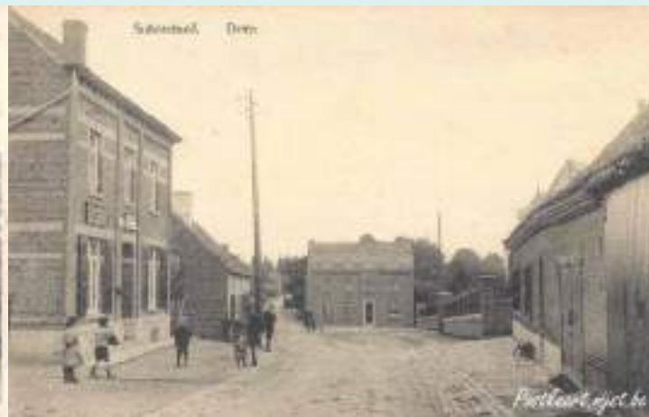
Zowel in het centrum van Wiemesmeer als in dat van Zutendaal zien we op oude postkaarten de eerste houten elektriciteitspalen