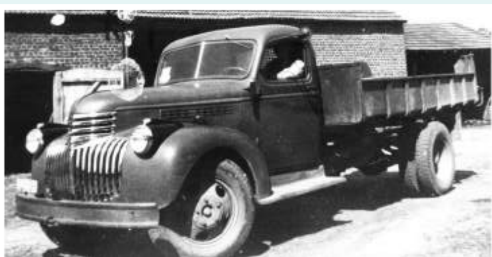
De camion van 'bij Sisse' (Gregoor) in Gewaai

We hadden in huis een grote open schouw. De oven stond buiten maar we stookten 'm langs binnen. Er stond ook een koeketel. Dat werd allemaal langs elkaar gestookt. Er lag dan ook altijd een schans bij en er stond een 'baessem' om alles bijeen te borstelen. Het lag een beetje aan de wind of de damp het huis binnenkwam. Als hij van de boskant waaide dan moesten we altijd de deur dichtdoen. Dan dampte het. Als hij van de andere kant kwam dan sloeg de damp terug.