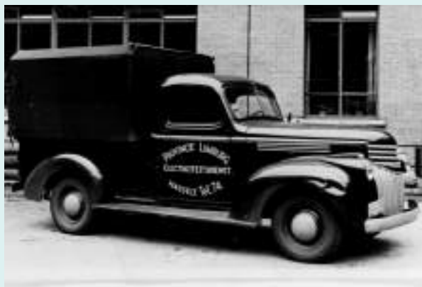
Pick-up van de Limburgse Electriciteitsdienst