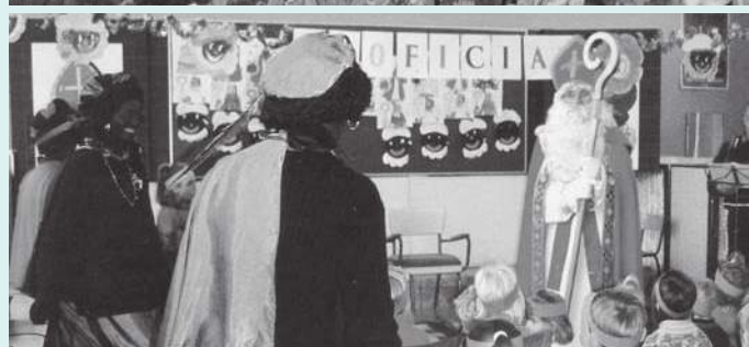
Sint en Piet op bezoek in de Zutendaalse scholen