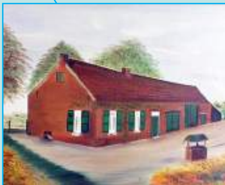
Boerderij waar Mieke vanne Hêi woonde voordat het vliegveld er kwam (schilderij A. Berger)