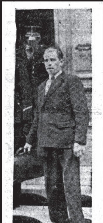
Miskende liefde bracht Habex tot de misdaad.