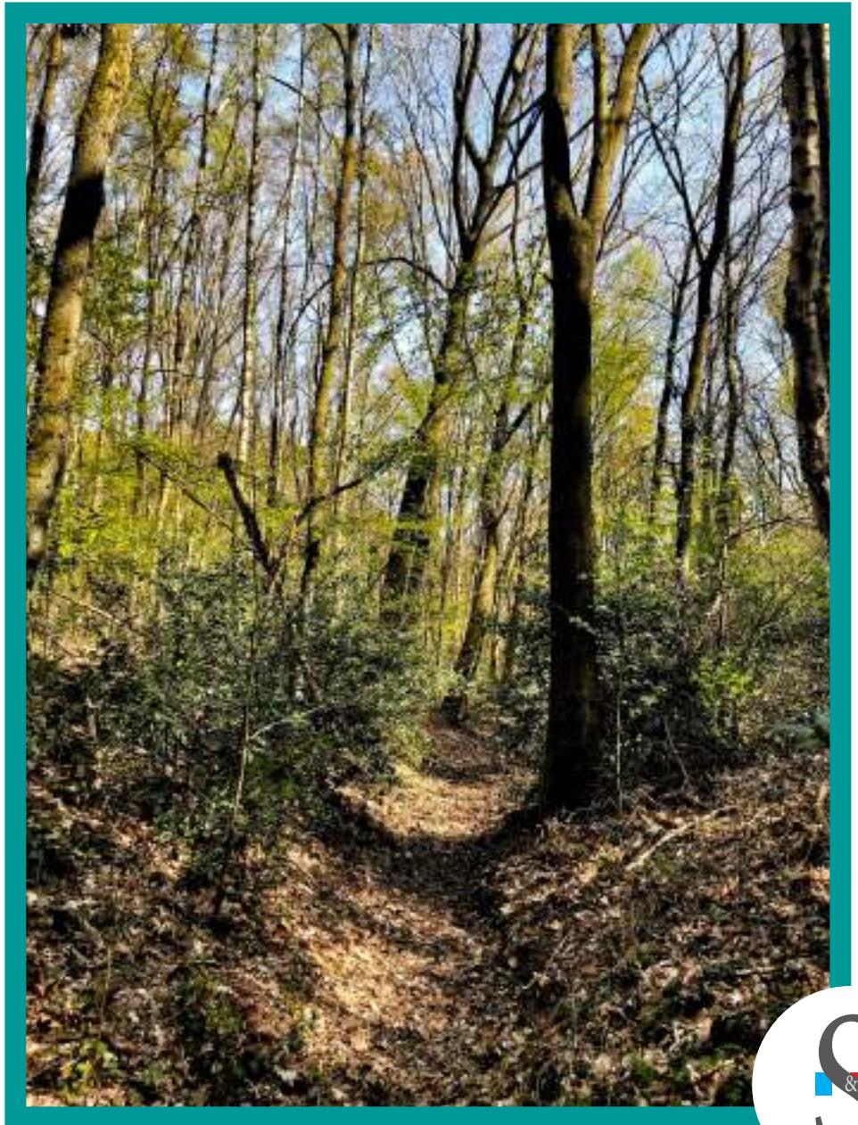
Holle weg tussen Dorp en Gebroek

Zutendaal telt er ook een aantal, niet zo spectaculair als in de Voerstreek of Haspengouw maar toch het behouden waard. Vandaar dat Soennes & Swaerdes zich gaat inzetten voor het terug in gebruik nemen van één van de mooiste holle wegen in Zutendaal, gelegen op een plaats die uitermate geschikt is. Vanaf de parking in de sportzone kun je er als wandelaar starten en via het 'Niehskespèdsje', één van onze trage wegen, door het gehucht Gebroek al wandelend het overgangsgedebied Kempen-Haspengouw verkennen en het stiltegebied Zwarteput beleven.