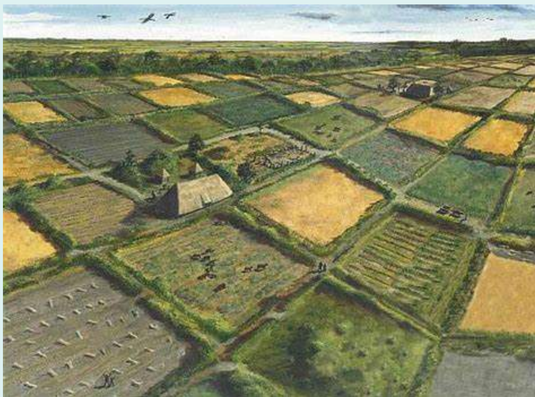
De vrij recente ontdekking van Celtic Fields op de Roelerheide geeft aan dat er zo'n 2500 tot 3000 jaar geleden in Roelen al mensen woonden en er hun (graan)akkertjes (Celtic Fields of raatakkers) bewerkten.

Hoe gaan we dat doen? In de eerste plaats roepen we de hulp in van onze leden en sympathisanten. Jullie dus. We zullen, net als bij de Vlaamse Canon, met thema's, hoofdstukken en blikvangers werken. En keuzes moeten maken.