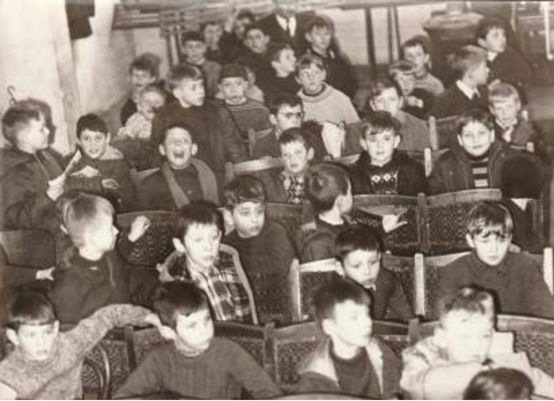
Binnenzicht in de zaal van het Katholiek Volkshuis (eerste helft jaren 1960?). Let op de oude houten muziekstaanders van de fanfare links op de achtergrond en de grote kolenstoof rechts achteraan. Bemerkt ook de tot op de draad versleten 'cinemastoele'.