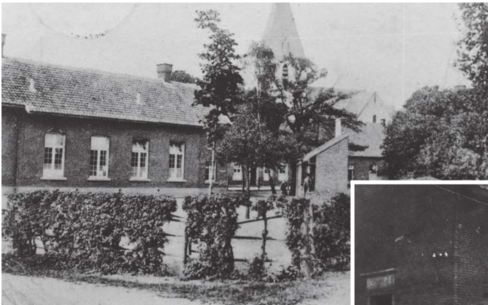
Oude postkaart van de gemeenteschool. Aan de rand van de speelplaats, rechts op de foto, stonden de toiletten.

In 1925 werden de eerste lokalen van de gemeenteschool langs de Schoolstraat gebouwd en diende het gebouw als gemeentehuis, OCMW, politiekantoor en gemeentelijke bergplaats waar o.a. de "sjèppe" (spaden) stonden.